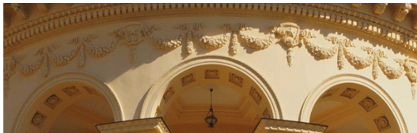
Рис. 1. Орнаментальный раппортный узор на главном корпусе санатория «Сочи» в г. Сочи, архитектор Ф.Р. Козюрин, 1947.

Здесь скульптурно выделяются имитированные ликторские связки или пучки, гирлянды, сочетания венков из дубовых ветвей и лент, медальоны, сандрики, орнаментальные раппорты оконных узоров. Главный акцент – раппортные узоры из сложных цветочных и фруктовых гирлянд, венков, советской символики (рисунок 1).