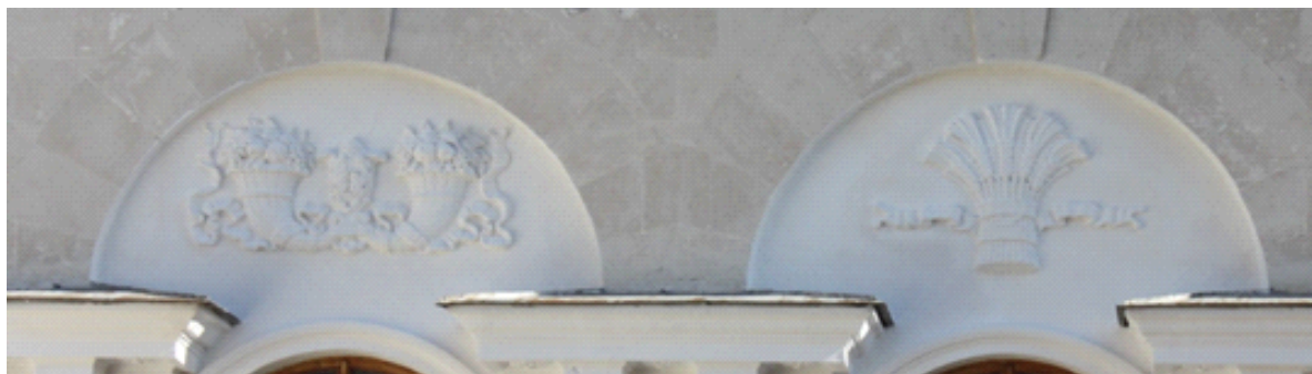
Рис. 2. Декор на фасаде главного корпуса санатория «Россия» в г. Ялте, архитектор И.Г. Кузьмин, 1950 г.

Композиционный ряд, украшающий экстерьер зданий санатория «Россия» отличается. Декорированное убранство главного корпуса весьма аскетично, однако орнаментальный ряд все же присутствует, представляя собой отдельно расположенные композиции, изображающие гирлянды и рога изобилия, полные характерных для южных территорий фруктов, виноградных гроздей, венка из колосьев пшеницы, оплетенного лентами (рисунок 2).